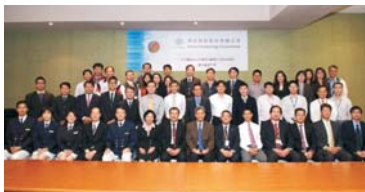
「南亞科技公司完成驗證後合影」 “Nanya Technology Corporation-Taiwan Customs AEO & ISO 28000 Joint Validation/Assessment”