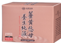
薑黃悠甘養生純液 (6 瓶入)