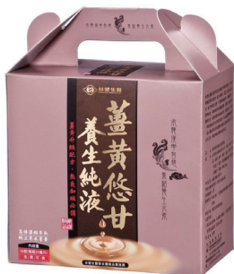
薑黃悠甘養生純液 (30 瓶入)

您的健康就交給台塑生醫守護！歡迎企業同仁至全省台塑生醫 FORTE 直營門市、台塑購物網、員工福利品登記、杏一醫療通路與 MOMO 購物等各大網購平台選購，健康諮詢專線 0800-211-168。