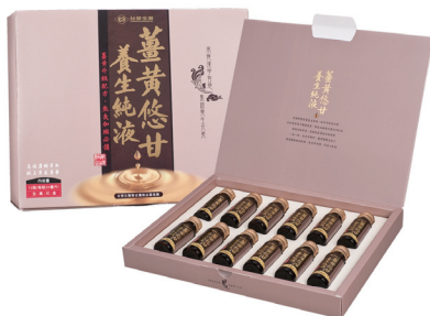
薑黃悠甘養生純液 (12 瓶入)