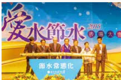
▲沈榮津經濟部次長用水績優單位頒獎頒獎

台灣多山，河川急流入海水資源不多，須提高用水回收率及廢水之回收使用，本廠將持續進行節水減廢，對環境盡一分心力留給後代一個美好的地球，並以止於至善的精神，持續在工安環保上努力。