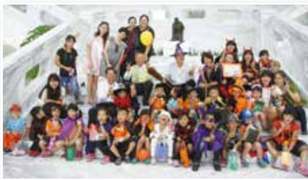
▲卡爾蕎幼兒園至麥寮行政大樓進行萬聖節活動

「Trick or treat. Trick or treat.」位在麥寮鄉的卡爾蕎幼兒園的小朋友們化身爲吸血鬼、巫婆、木乃伊、惡魔等小鬼怪，在陽光燦爛的中午時刻，搭上裝載著期待的遊覽車，帶著各式各樣的魔法器皿來到台塑麥寮園區，由陳副總、鄭協理及管理部同仁帶領下，進入神秘的雪白宮殿（有小白宮之稱的行政大樓），準備來一場魔法糖的爭奪之旅。宮殿中忙碌的人們也在可愛的小鬼怪們來到之後，暫時放下手邊的工作，將事先準備好並注入滿滿祝福的魔法糖，以最真心的微笑及最溫暖的雙