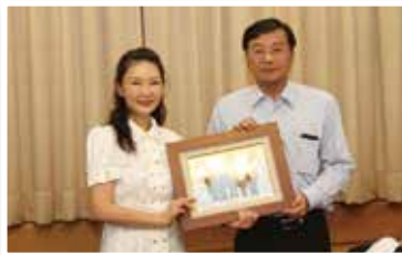
▲王總經理致贈大廳合影相片，曾主委盛讚本企業效率一流

就不用洗澡，讚美之意乃是溢於言表。一行人於北碼頭觀景平台下車，眼下望見清澈水中悠游魚群，以及附著碼頭鋼柱上之野生牡蠣，在在都能印證工業和環保發展可達到平衡之境，亦代表本企業永續經營之用心。