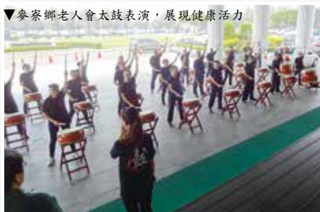
▼麥寮鄉老人會太鼓表演，展現健康活力

戰鼓或太鼓表演不同，麥寮鄉老人會的太鼓搭配著「再出發」和「小蘋果」等流行歌曲進行演出，鮮明的歌曲節奏加上整齊的太鼓聲、劃一的動作和流暢的走位步伐，