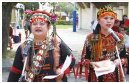
▲原住民高亢嗓音為祭典揭開序幕

創辦人亦有感於許多原住民青年缺乏一技之長，致使就業不易，因此又於明志工專長期辦理原