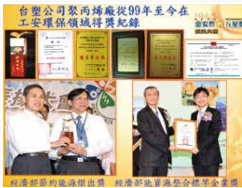
▲台塑林園聚丙稀廠工安環保得獎紀錄

產環保無毒產品、積極使用無毒原料、降低生產能源耗用，於98年獲得經濟部節約能源傑出獎、100年獲得高雄市企業節能卓越獎、102年獲得經濟部清潔生產證書及能資源整合標竿企業，持續對環境盡一分心力。