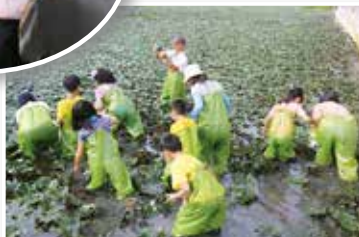
▲民眾穿著青蛙裝體驗採收菱角之樂趣