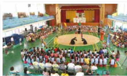
▲四湖國小全校師生觀賞表演

揚文化藝術，今 (104) 年持續贊助法鼓山心劇團校園巡演，共 14 所國小及 1 所鄉立幼兒園約 1,600 位學童觀賞，經由轉動幸福，從「心」開始，為偏鄉沿海學童帶來更多歡笑與資源。