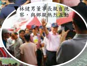
林健男董事長親自視察，與鄉親熱烈互動