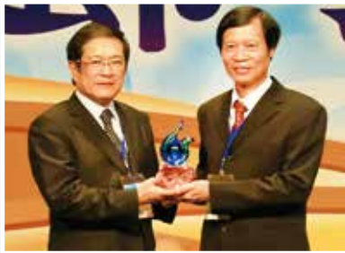
▲吳副總統蒞臨主持節約用水頒獎

華亞汽電公司汽電廠獲得經濟部水利署「104 年度節約用水績優單位績優獎」，104 年 11 月 19 日由台朔重工公司洪崇發資深副總經理出席表揚活動，並接受吳敦義副總統及沈榮津經濟部次長頒獎。