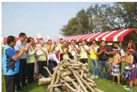
▲縣長李進勇象徵性點燃祭典營火

陳文仰、協理鄭旺家、縣長李進勇、議員許志豪、張健福及林深等貴賓肩背情人袋，共同象徵性點燃營火後，與現場 300 多位原住民朋友一起暢飲小米露及跳舞同樂。