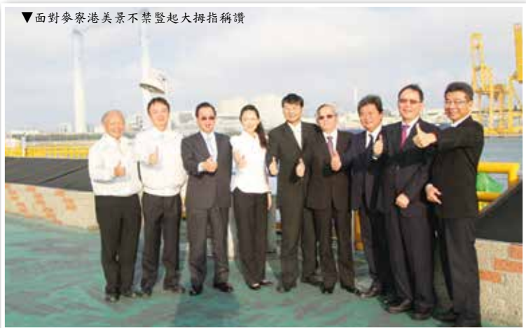
▼面對麥寮港美景不禁豎起大拇指稱讚

麥寮廠區建廠迄今 20 多個年頭，秉持兩位創辦人根留台灣、深耕地方精神，從無到有建立全世界最大單一石化園區，前年中評社社長參訪後甚至表示本廠區體現三大奇蹟：一是工業奇蹟，環保觀念走在前頭、二是經濟奇蹟，為台灣經濟做出重大貢獻、三是精神奇蹟，「勤勞樸實」精神也是台灣精神。也因如此別具意義，所以每年到訪人數可媲美鄰近觀光景點，並成為雲嘉南沿海地區亮點之一。104 年 11 月 20 日金管會曾銘宗主委、證交所李述德董事長、聯合信用卡中心劉燈城董事長及券商公會簡鴻文理事長四位金融大腕暫放手邊繁忙公務，風塵僕僕自台北驅車南下蒞臨本廠區參訪。