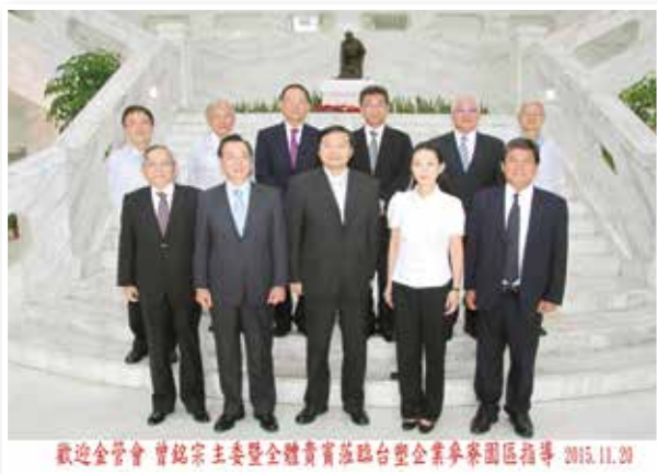
歡迎金管會 曾銘宗 主委暨全體貴賓蒞臨台塑企業參訪園區指導 2015.11.20