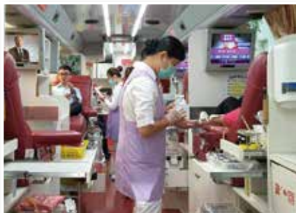
▲同仁及包商以實際行動響應捐血

「高雄捐血中心」護理師提到因部分捐血中心庫存量總是偏低，很感謝台塑同仁們把關懷轉化成行動，響應捐血救人義舉。捐血不僅可以促進血液新陳代謝，增進自己的身體