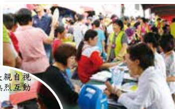
▲長庚中西醫義診，民眾踴躍參與