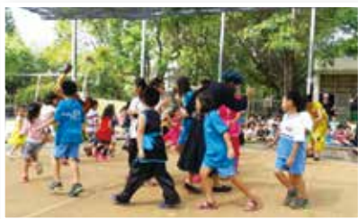
▲學童參與劇情表演，歡笑聲頻頻

中冒險的情境，透過體驗教育，引導學童深入體會作品中隱喻的教導與分享。戲劇中主角名為「財富」，主要係隱喻帶來學童心靈層次的財富，但有許多學童分享時表示，希望擁有更多物質上的財富來改變現況，