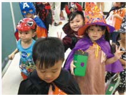
▲小朋友開心展示自己的裝扮

手將糖果與幸福分送給每一位小朋友，希望能帶給孩子們最甜蜜的喜悅。在活動的過程中，整棟行政大樓迴盪著小孩純真的笑聲、家長愉悅的閒聊聲，以及彼此祝福感謝的真摯心聲。化身為鬼怪的孩童們在收到了加注幸福的魔