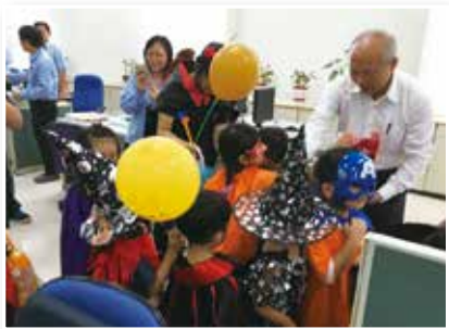
▲副總發糖與小朋友同樂