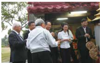
▲眾人向土地公祈求保佑台灣國泰民安

動地以「吃一條魚」來比喻本廠區於環保展現之優勢，因為是上中下游垂直整合，原料就如同魚的每個部位都有相應工廠能「吃」、能處理，如此一來除具經濟效益外，排放量也更減少、更為環保，