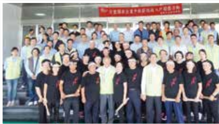
▲麥寮鄉老人會與廠鄉促進會會員預祝低收入戶關懷活動圓滿成功

場面震撼人心，所展現出的力與美，相較於坊間常見傳達體育或宗教意涵的太鼓表演，更好的展現出了健康和活力的年長者生活。咸信相關活動對於年長者的人際互動、團隊合作精神、舞台自信心都有相當程度的助益。