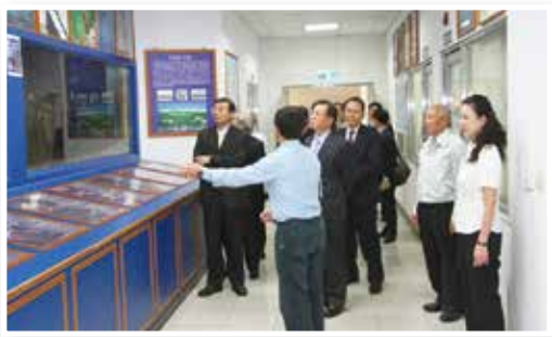
▲參訪生態實驗室瞭解廠區對環境保護之用心

進入麥寮港，海天一色美景及清澈見底海水，證明甲類海域水質非浪得虛名，無怪乎先前基隆民眾參訪麥寮港時表示，若黃色小鴨停放麥寮港