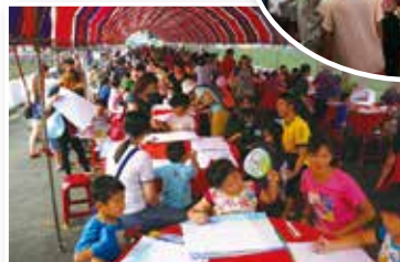
▲「工安環保成果展」與民眾互動，深受喜愛