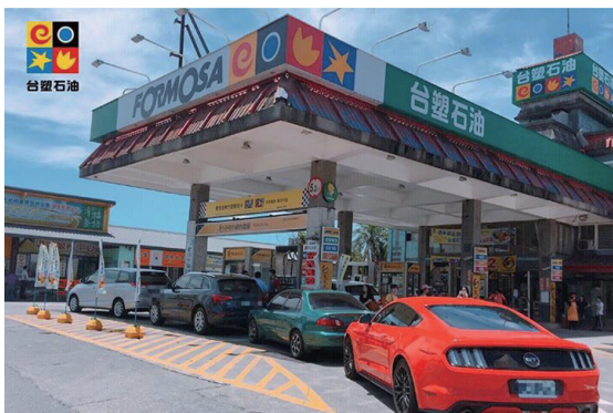
假日的台塑加油站，排滿了等待加油的汽車長龍

即受到消費者熱情的支持，可口可樂幾乎是每天都兌換一空；而到了假日，加油站更是排滿了等待加油的汽車長龍，為的就是美味可口的池上飯包！