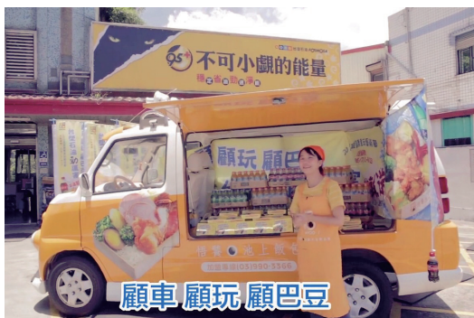
悟饕池上飯包可愛的餐車，帶給遊客一份份美味可口的飯包

暑假天氣炎熱，小孩子若能夠有一瓶清涼消暑的可口可樂是最開心不過的事！本次活動與太古可口可樂合作，消費者只要在童玩節舉辦期間（七月一日至八月十三日）至宜蘭的台塑加油站汽油加滿三〇公升或柴油加滿六〇公升，即贈送可口可樂GS+乙瓶。台塑石油還很貼心地考慮到前來童玩節的人潮眾多，遊客往往難以找到餐廳可以用餐。因此特別邀請宜蘭知名連鎖業者——悟饕池上飯包一同共襄盛舉，於活動期間的星期五、六、日特別加碼贈送飯包兌換券乙張，讓消費者真的能「有吃又有玩」。