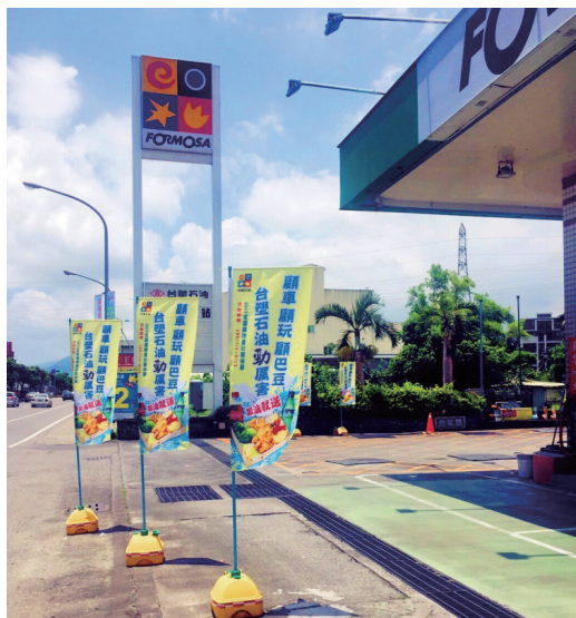
冬山加油站飄逸著宣傳活動的關東旗

同樣是不斷求新求變的台塑石油，近年除了推出深受消費者喜愛的「省攞有力」GS+汽油、「耐動耐操」的全新配方超級柴油外，在加油站行銷規劃上，一樣勇於突破創新，替在地消費者量身打造新奇有趣的促銷活動。本次為了讓來自各地的遊客都能盡情享受宜蘭的一切美好，台塑石油和地方加油站業者合作，強勢推出「加油就送」的活動，要讓民眾「顧車、顧玩、顧巴豆」！