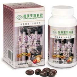
圖二、長庚生技「男攝利舒」軟膠囊