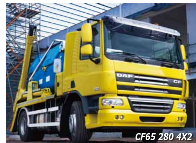
CF65 280 4X2