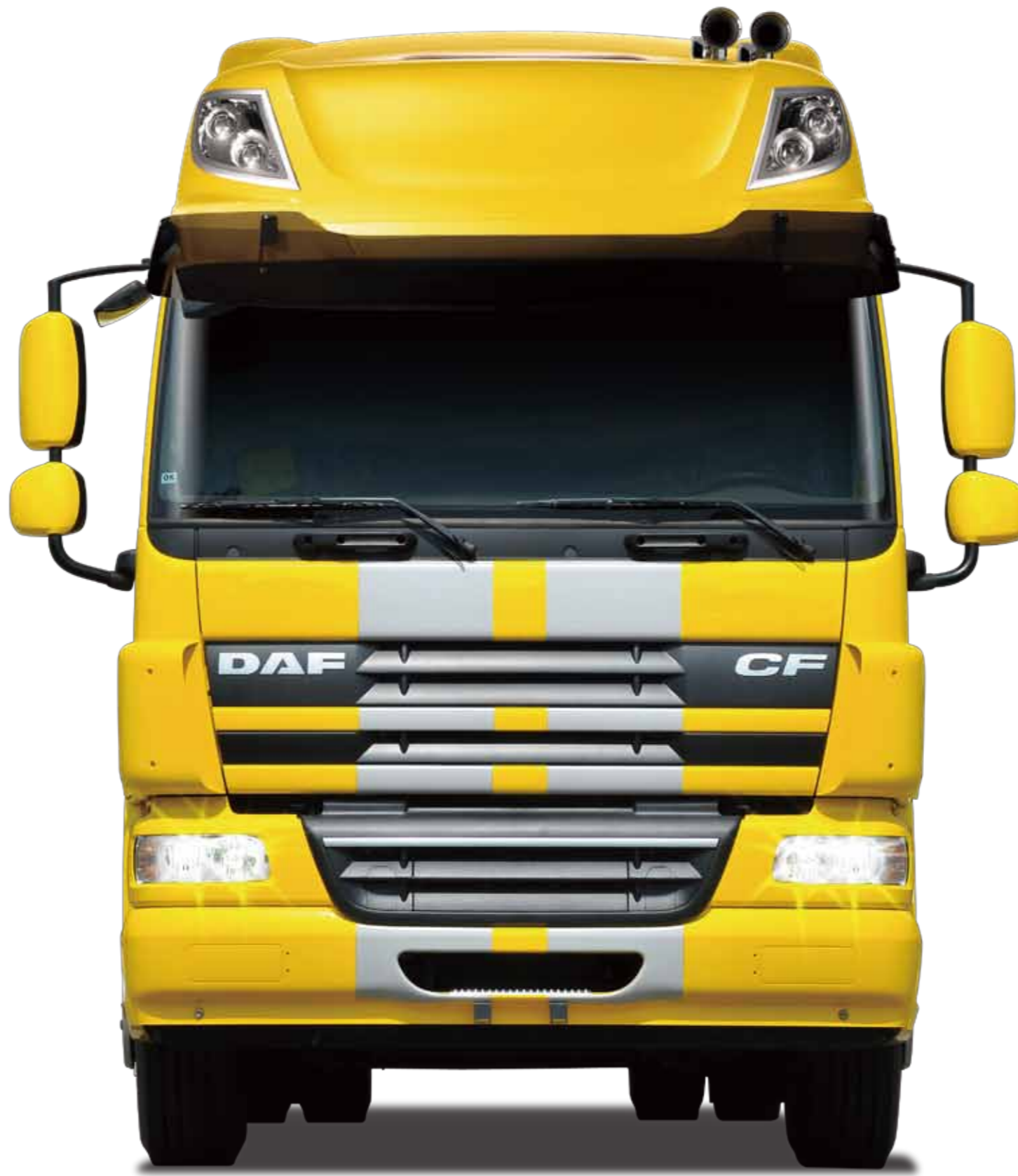
▲本車為 CF65 280