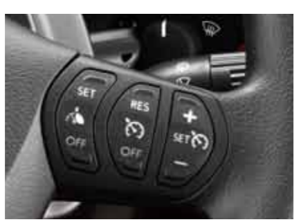
定速駕駛是達富中大型貨車的標準配備