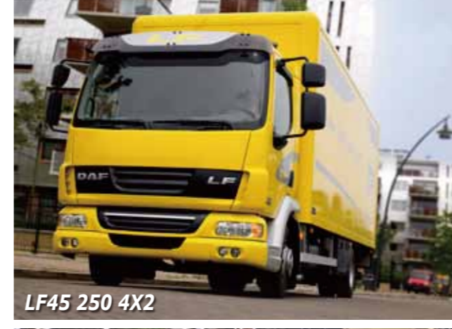
LF45 250 4X2