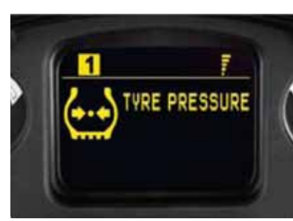
胎壓顯示 (LF 車系)