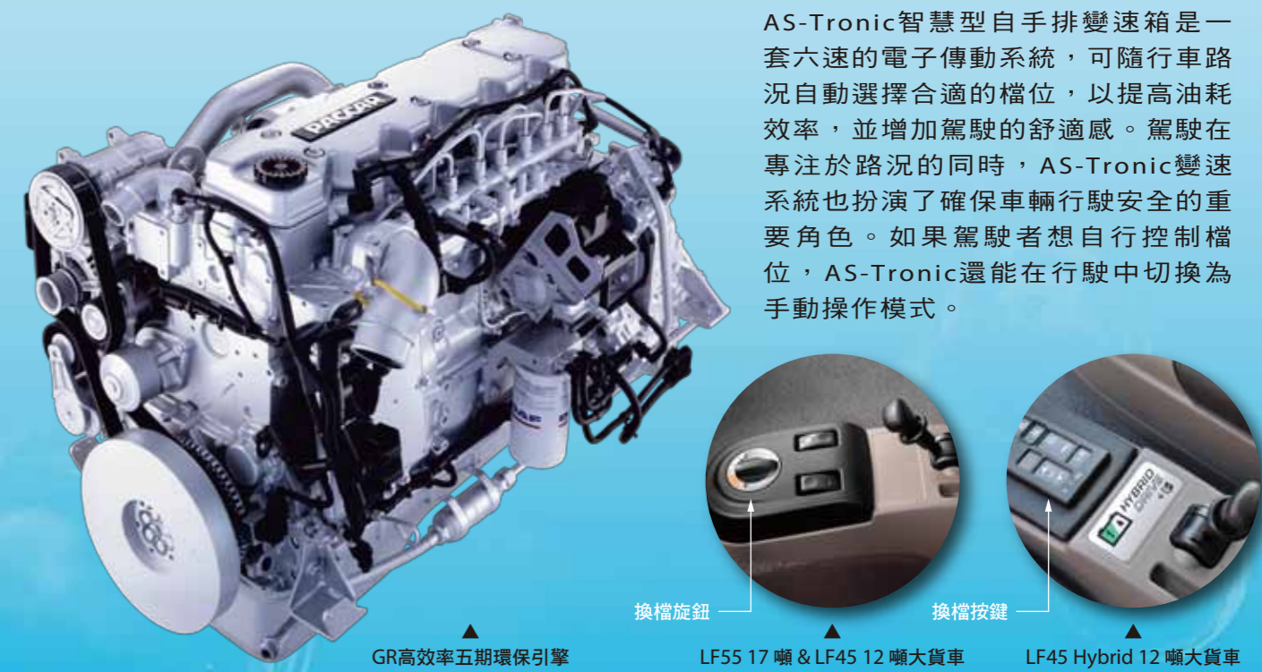
GR 高效率五期環保引擎