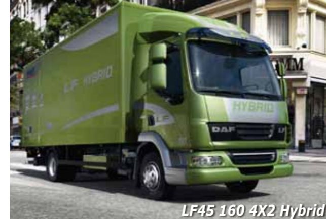
LF45 160 4X2 Hybrid