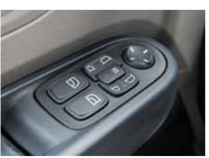
電動加熱除霧後視鏡 (CF65 280)