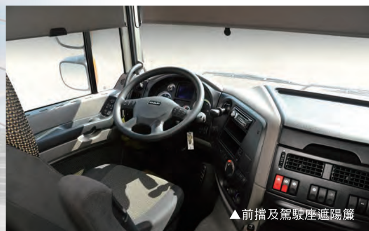
▲前擋及駕駛座進場

大空間座艙，高標準的人體工學及內裝設計，創造驚豔的工作行車品質，更有寬敞舒適的行動生活空間，掌握最頂級的駕駛樂趣。